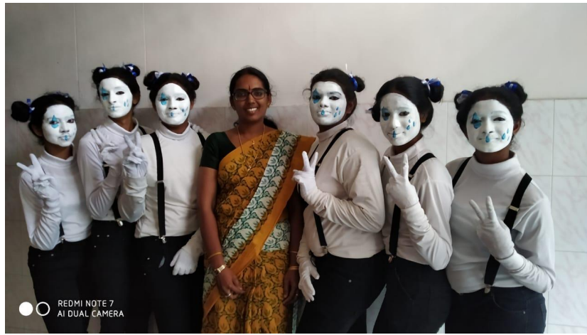
OPPANA-PRIZE WINNING TEAM