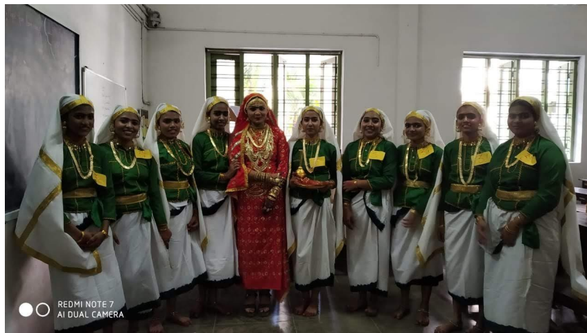
MARGAM KALI-PRIZE WINNING TEAM