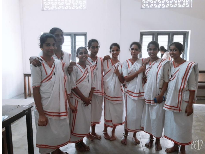
CHRISTMAS CAROL-PRIZE WINNING TEAM