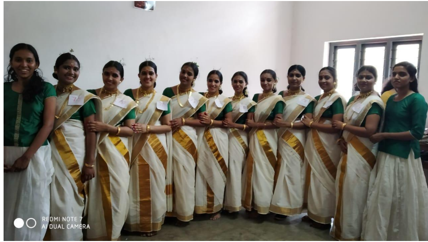
MIME-PRIZE WINNING TEAM