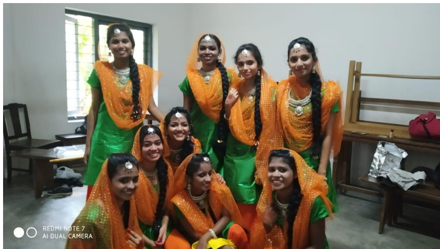
THIRUVATHIRA-PRIZE WINNING TEAM