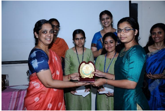
MANUSCRIPT MAGAZINE RELEASE "VAAKA"