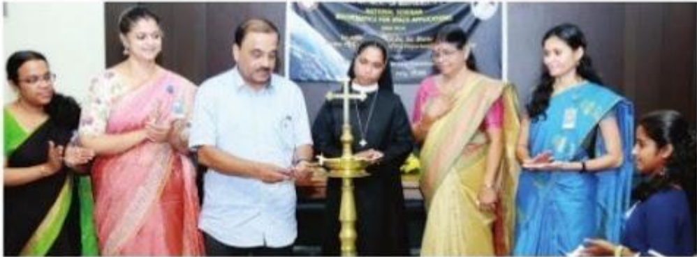
ആലുവ സെന്റ് സേവ്യേഴ്സ് കോളജിൽ നടന്ന ഗണിത ശാസ്ത്ര ദേശീയ സെമിനാർ വിഘ്നസ്തംഭി-ഐഎസ്ആർ മാനേജ്മെന്റ് സിസ്റ്റംസ് മുൻ ഡയറക്ടർ പി. രതീന്ദ്രകരറാവു ഉദ്ഘാടനം ചെയ്യുന്നു.