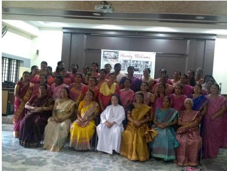
GROUP DANCE PRIZE WINNING TEAM