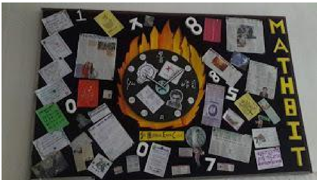
WORKSHOP ON NEWSPAPER ART