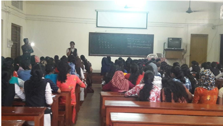
CERTIFICATE COURSE-MATHEMATICAL APTITUDE