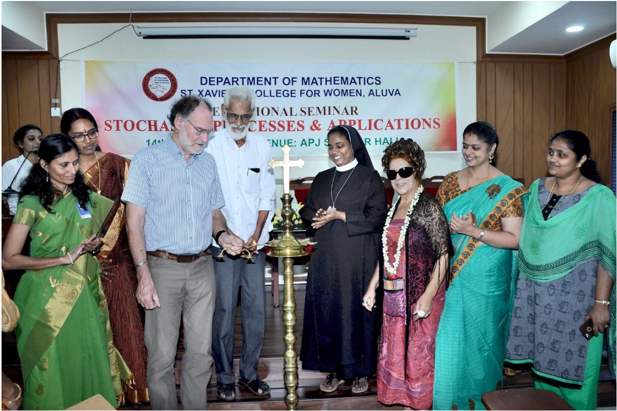
TALK BY PROF REIN D NOBEL